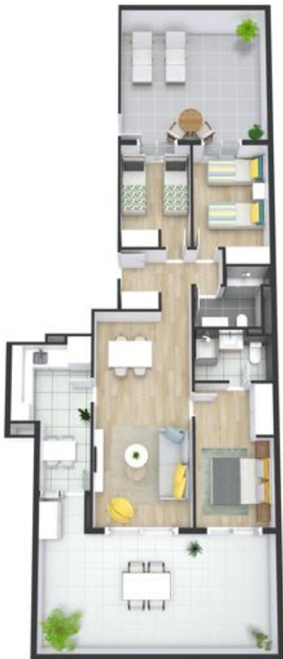
C/ ROSA SENSAT